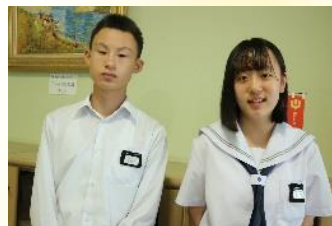
第14期生（越前中学校 3年生）