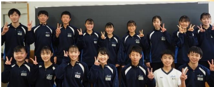
第14期生（朝日中学校 3年生）