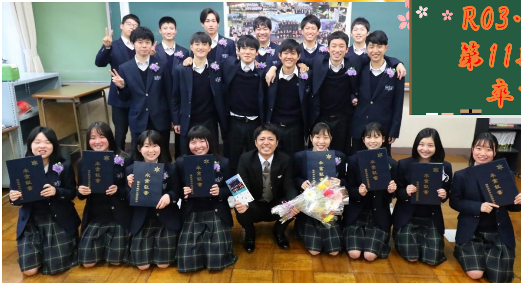
第11期生（丹生高等学校 3年生）