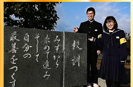
第14期生 （宮崎中学校 3年生）