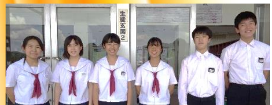
第14期生（織田中学校 3年生）